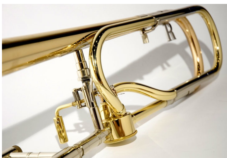
Open Wrap (Rath)

Voor de meer volgroeide speler en de speler met wat meer ervaring is een grote boring met kwart-ventiel aan te bevelen. Een kwart-ventiel breidt het bereik van de trombone uit naar het lage register. „Open wrap” betekent dat het buisgedeelte van het ventiel in een ovaal gemaakt is. Zo kan de lucht door het ventiel en de buis vrij doorlopen wat erg belangrijk is voor de lucht.