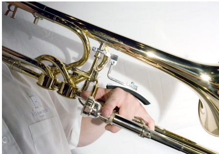
Handsteun op een bastrombone (Rath)