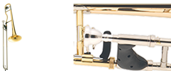
Ergonomische trombone (Jupiter)

Voor een beginner is een Yamaha YSL-354(E) of de YSL356 een goede keuze. Het zijn duurzame instrumenten van goede kwaliteit. Jupiter heeft een speciale ergonomische trombone met een goede handgreep en een aangepaste „gooseneck”