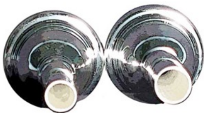
kleine- en grote boring mondstuk

Neem tijd om een mondstuk uit te proberen. Een nieuw/ander mondstuk lijkt in eerste instantie altijd beter maar wanneer je er langere tijd op speelt weet je pas echt of het is wat je voor ogen hebt.