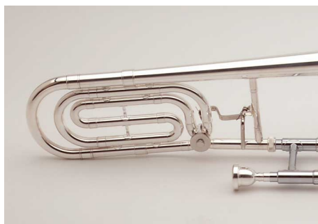
geen open wrap